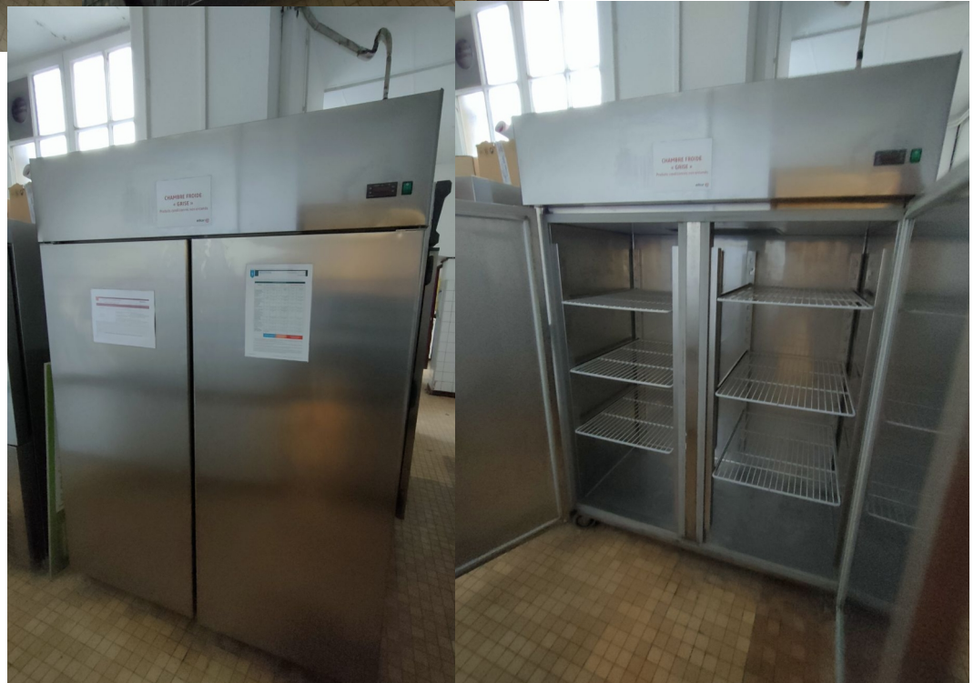
Numéro 2 1 Chambre froide