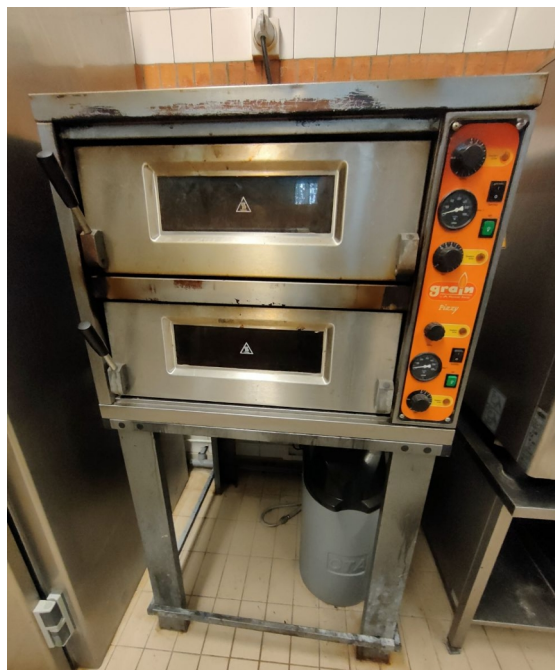
1 four à pizza