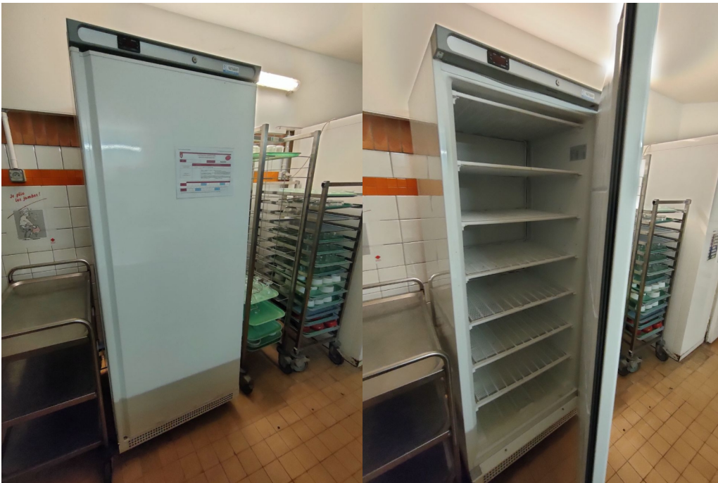
Numéro 11 1 congélateur