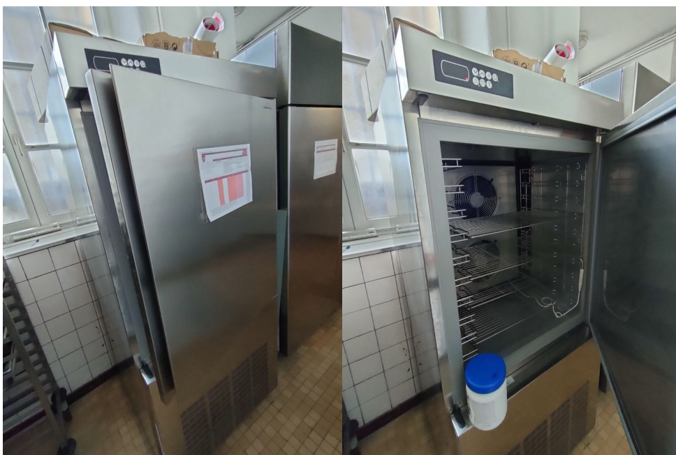
Numéro 3 1 Cellule de refroidissement