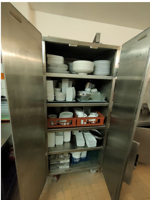
Numéro 15 Lot de vaisselle