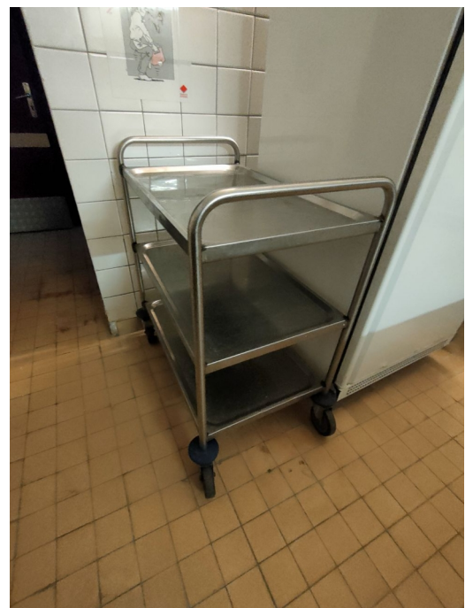
Numéro 12 1 chariot