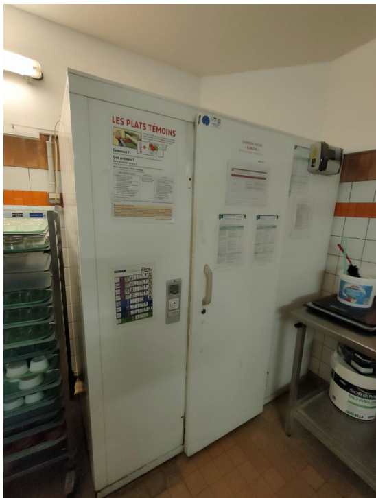
Numéro 9 1 chambre froide