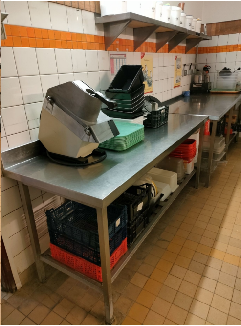
Numéro 7 5 tables