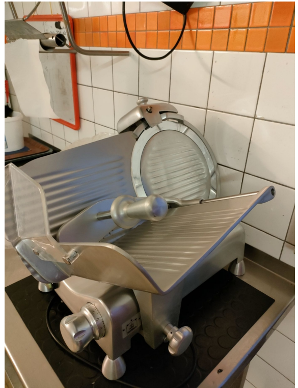
Numéro 8 1 trancheuse