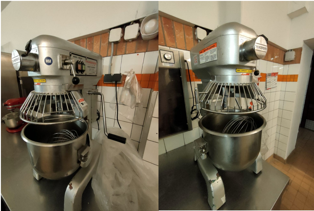
Numéro 13 1 mixeur