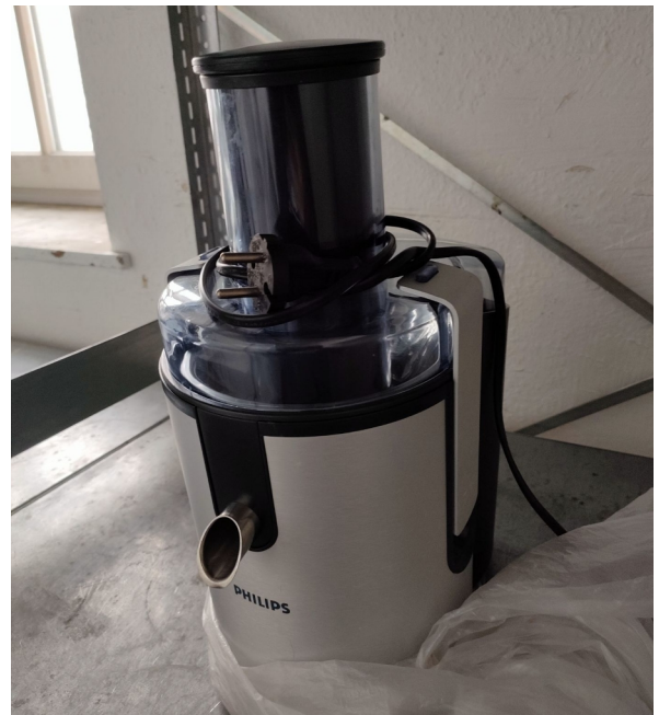
Numéro 56 1 appareil pour jus de fruit