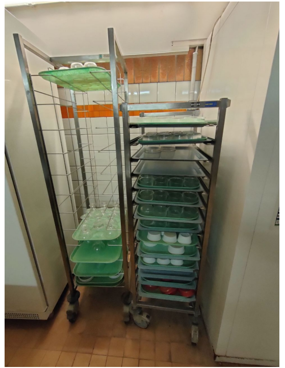
Numéro 10 2 chariots « pose plat »