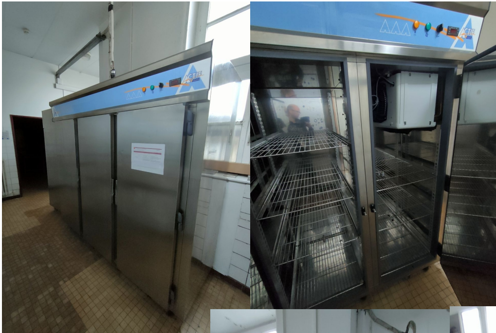
Numéro 1 1 Chambre froide