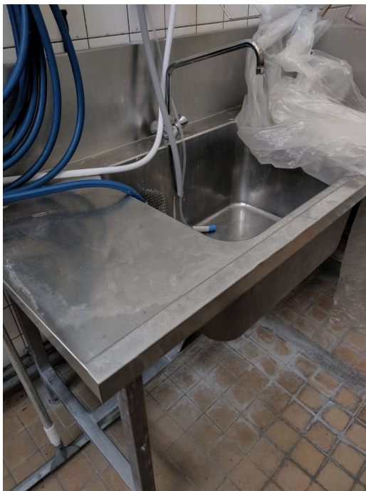
Numéro 57 1 évier