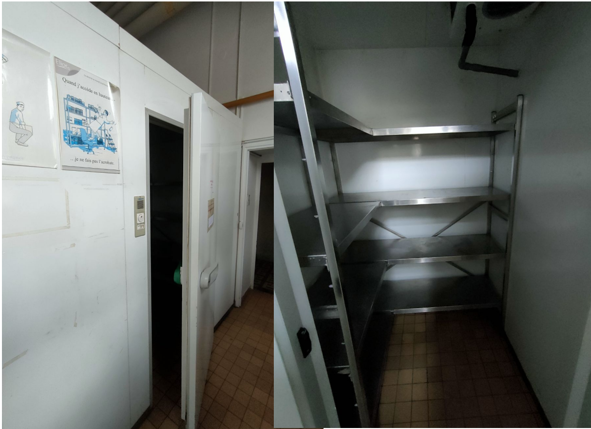
Numéro 55 1 chambre froide