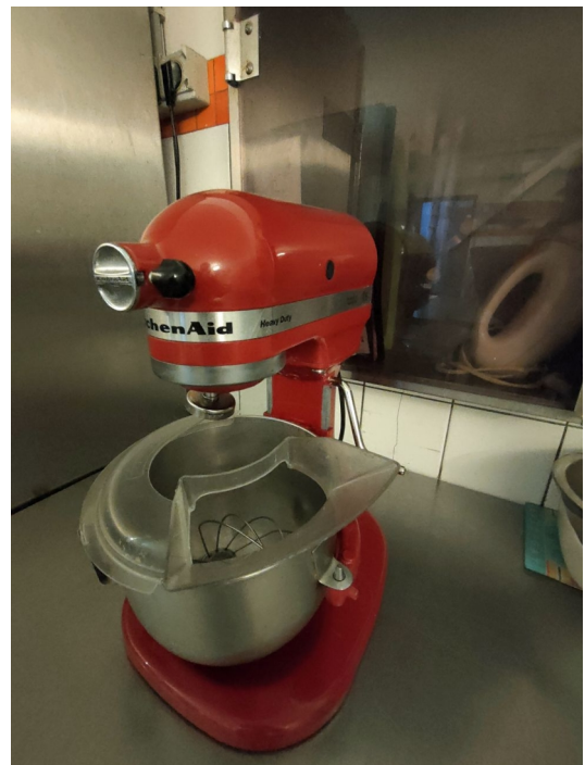
Numéro 14 1 kitchenaid